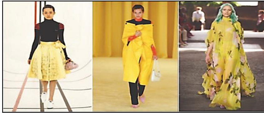
شكل (٤) اللون الأصفر في عروض الأزياء (٤٥)

٢- اللون الأصفر: وهو لون من ألوان الأمل في المستقبل ومحاوله التغلب على اليأس والخوف، كما يظهر بشكل (٤).