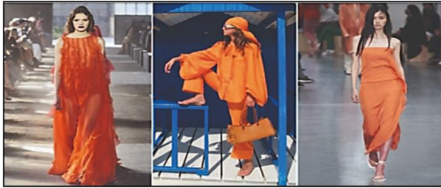
شكل (٥) اللون البرتقالي في عروض الأزياء (٤٥)

٣- اللون البرتقالي: وهو لون التفاؤل ومحاوله للإنطلاق وهو من الألوان الدافئة المستمدة من الشمس في محاولة نفسية للإشارة بسطوع شمس التفاؤل خاصة مع البدء في الفتح التدريجي بمعظم البلدان بعد الإغلاق الكامل أو الجزئي، كما يظهر بشكل (٥).