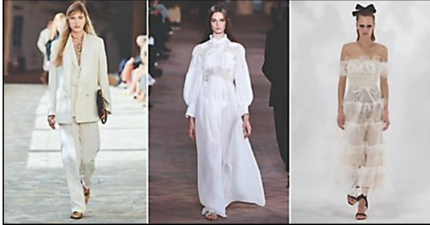
شكل (٧) اللون الأبيض في عروض الأزياء (٤٥)

٥- اللون الأبيض: وهو أيضا من تأثيرات وتبعات الوباء حيث أن اللون الأبيض هو اللون الرسمي لملايس الأطقم الطبية التي تعلق بها الناس جميعاً باعتبارهم ملجأ الأمان في مواجهة هذا الوباء العالمي، كما يظهر بشكل (٧).