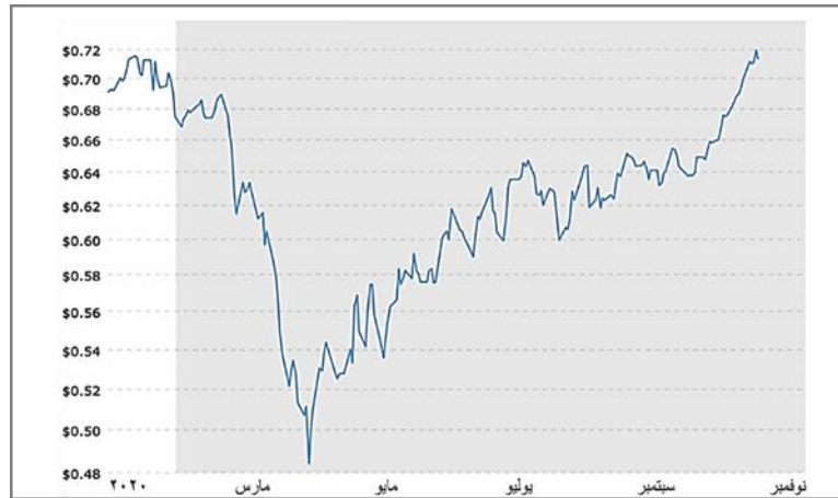
شكل (٨) اسعار القطن من مارس -نوفمبر ٢٠٢٠ (٣)

أدى إلغاء الطلبات في البداية إلى خفض أسعار القطن القياسية بمقدار الثلث تقريباً في ذروة الجائحة لتصل الي ٢١٠٠ جنيه للقطن، ولكنها سرعان ما عادت خلال ٢٠٢١ لتصل الي ٥٦٣٠ جنيه للقطن، وبسبب الجائحة عانت الزراعة أيضاً ومع زيادة التركيز على المحاصيل الغذائية، يتم تهيمش المحاصيل النقدية بسبب انخفاض الطلب وسيعوض إنكماش في العرض بسبب توقف بعض الشركات عن العمل بعض الإنخفاض في الطلب، ويشهد على ذلك الإنتعاش في أسعار القطن على الرغم من التوقعات بانخفاض حاد، كما يتضح بشكل (٨).