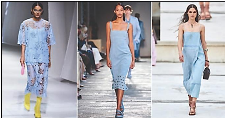
شكل (٦) اللون اللبني في عروض الأزياء (٤٥)

٤- اللون اللبني: حيث مازال العالم متأثرا باللون الذي أصبح لصيقا بالكمامات الطبية وهو اللون اللبني، كما يظهر بشكل (٦).