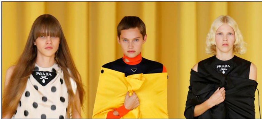
شكل (١) شعار الشركات بالجزء العلوي من الملابس تحت العنق (٤٥)

فعلي سبيل المثال نجد شركة برادا وضعت شعارها قريبا من الياقة (٤٥) ، وركزت تصميمات معاطفها الجديدة على الجزء العلوي. حيث أن وضع شعار الشركة على شكل مثلث تحت العنق يلفت الإنتباه أثناء إجتماعات العمل من المنزل -كما يتضح بشكل (١).