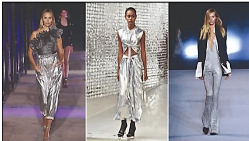
شكل (٣) اللون الفضي الميتالك في عروض الأزياء (٤٥)

كما نجد أن الجائحة قد ألقّت بظلالها حتى علي الألوان المستخدمة لتسيطر الألوان الأتنية علي ربيع وصيف ٢٠٢١: ١-الفضي الميتالك: وهو ما يمثل بعد نفسي حيث ان عنصر الفضة يتم استخدام ذراته بطريقة النانو لانتاج الاقمشة المضادة للبكتريا، كما يظهر بشكل (٣).