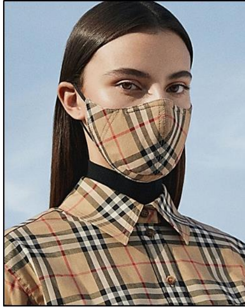
شكل (٢) تصميمات الأقمعة الواقية كنوع من الإكسسوارات للملابس (٤٥)

ونجد أيضا أن أقمعة الوجه أصبحت بمثابة الإكسسوار الذي لاغني عنه، وأنتجت العلامات التجارية تصميمات فريدة، وأصبحت بين عشية وضحاها اللمسة الأخيرة للعديد من خطوط الأزياء، حيث أصبح مفهوم الأزياء الوقائية اتجاه محدد وواضح ومرغوب - كما يتضح بشكل (٢).